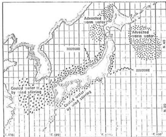
Fig 2. Geographical distribution of the marine environments around Japan, showing those temperature characteristics and location of ecotones.

日本の沿岸資源の発生場所が上記のような環境区の特徴のいづれかに属して発生し、幼稚魚